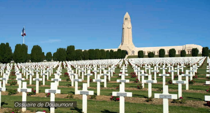
Ossuaire de Douaumont