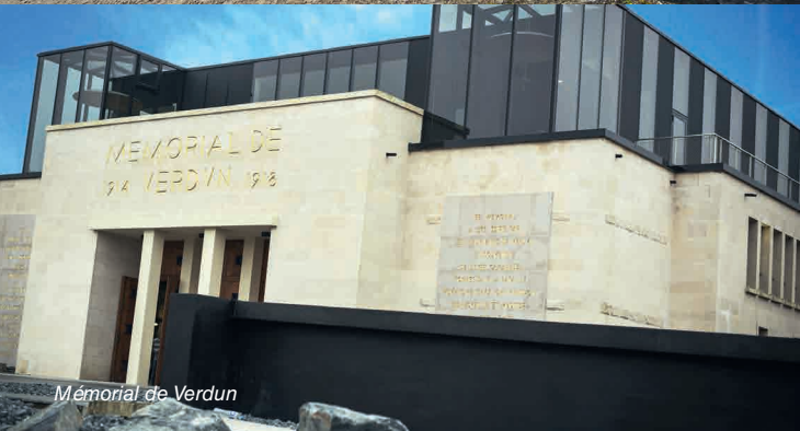
Mémorial de Verdun