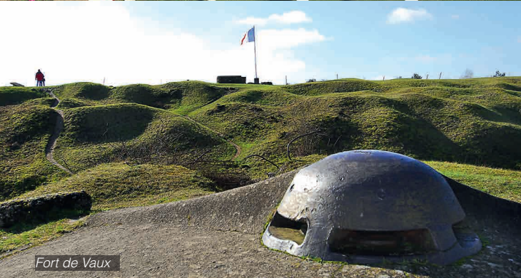
Fort de Vaux