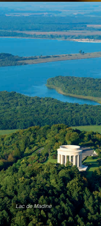
Lac de Madine